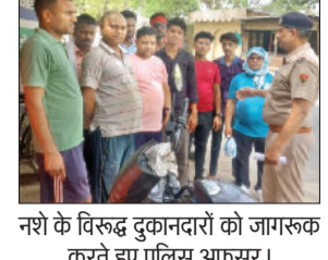
नशे के विरुद्ध दुकानदारों को जागरूक करते हुए पुलिस अफसर।