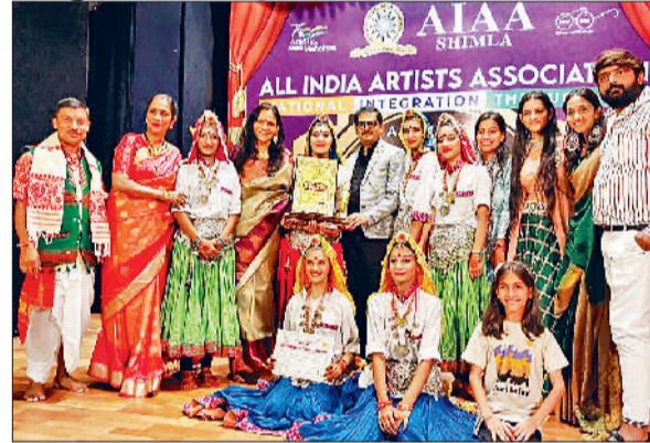
अंबाला। शिमला में आयोजित कार्यक्रम में बाजी मारने वाले कलाकार।