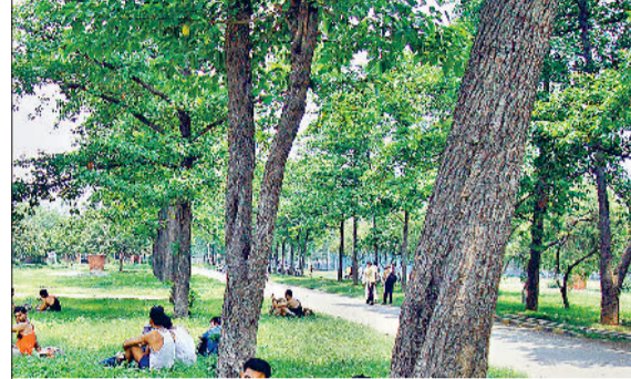
यमुनानगर में दोपहर के समय पार्क में पेड़ों की छांव में बैठकर गर्मी से राहत पाते लोग।

दो पहले जिले में हुई हल्की बारिश के बाद शनिवार को एक बार फिर मौसम में गर्मी की तपिश बढ़ने व उमस होने से दिन भर लोग हलकान रहे। शनिवार को दिन भर मौसम में गर्मी की तपिश बढ़ी रही और उमस बनने से लोग पसीना