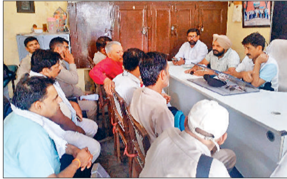
कुरुक्षेत्र। बैठक में मौजूद रोडवेज पदाधिकारी।