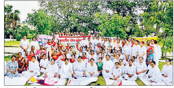
अंबाला। योग दिवस पर मौजूद साधक व वीके बहनें।

का खमियाजा जनता को भुगतना पड़ेगा। रगत वर्षों की तरह कपड़ा मांकट को फिर दूबने पर विचार होना पड़ेगा। करोड़ों रुपए का नुकसान सहन करना पड़ेगा साथ ही नदी मोहल्ला, नई बस्ती, सकुलर रोड, जगाधरी गेट सहित सारे शहर में बाढ़ जैसे हालात बन जाएंगे। वर्मा ने नगर निगम अधिकारियों से मांग कि की शहर में नालों की सफाई के कार्य में तेजी लाई जाए और अतिरिक्त कर्मचारियों को भर्ती की जाए ताकि शहर में बरसाती पानी से लोगों को होने वाले नुकसान से बचाया जा सके।