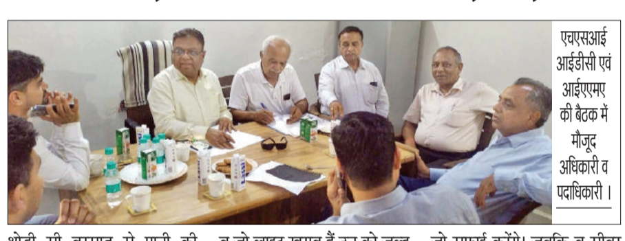
थोड़ी सी बरसात से पानी की निकासी में समस्या आ रही है। सीवर की सफाई जल्द से जल्द करवाई जाए। नाले की सफाई व नालों के ढक्कन जल्द से जल्द पूरे किए जाएं। स्ट्रीट लाइट की मरम्मत व जो लाइट खराब हैं उन को जल्द से जल्द बदला जाए आदि की मांगें रखी गईं। वहीं एचएसआईआईडीसी के अधिकारियों ने उन्हें आश्वासन दिया कि एचएसआईआईडीसी की तरफ से चार श्रमिक उपस्थित रहेंगे जो सफाई करेंगे। जबकि व सीवर की सफाई की मशीन का टेंडर अगले सप्ताह से लग जाएगा। जब तक टेंडर नहीं लगता सीवर सफाई की मशीन का प्रबंध एचएसआईआईडीसी करेगी।

एचएसआईआईडीसी एवं आईएमएए के अधिकारियों के बीच शनिवार को बैठक हुई। बैठक में बरसात से पहले नाले व सीवर सफाई व्यवस्था के बारे में विस्तार से चर्चा हुई ताकि आने वाले समय में बरसात पानीपत के भराव से होने वाले नुकसान से बचा जा सके। बैठक में उद्योगपतियों द्वारा अधिकारियों को बताया गया कि