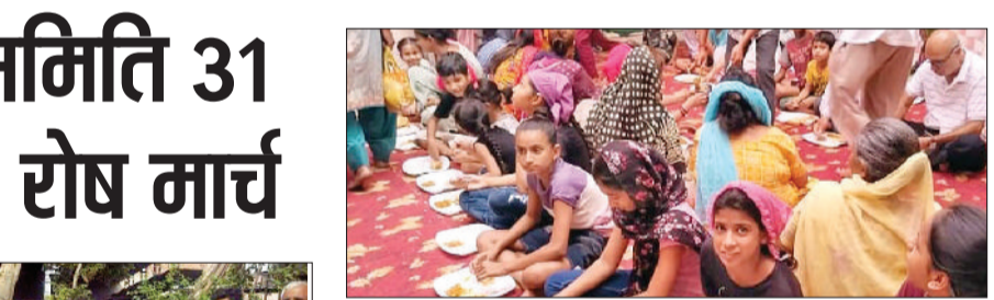
वार्षिक महायज्ञ का आयोजन किया