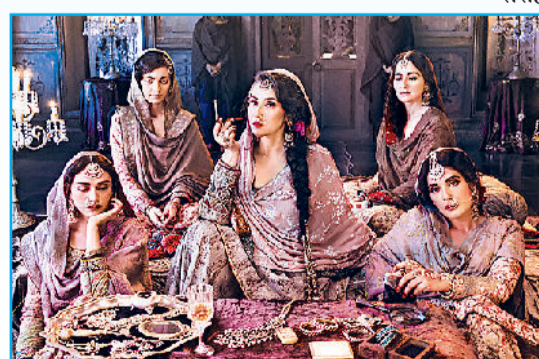
'हीरामंडी' में को-ऑर्टिस्ट के साथ लज्जो के किरदार में रिचा चड्ढा

पिछले दिनों ओटीटी प्लेटफॉर्म पर रिलीज हुई संजय लीला भंसाली निर्देशित वेब सीरीज 'हीरामंडी' में आप लज्जो के किरदार में नजर आ रही हैं। इसे दर्शकों ने खूब पसंद किया। आप क्या कहना चाहेंगी? हर कलाकार चाहता है कि उसे भंसाली सर के साथ काम करने का मौका मिले। एक स्त्री का चित्रण जिस खूबसूरती से भंसाली सर करते हैं, वैसा किसी और के लिए करना मुश्किल है। वे हर फ्रेम को बेहद सुंदर बना देते हैं। परफेक्शन का दूसरा नाम है- संजय लीला भंसाली। 'हीरामंडी' में लज्जो का किरदार निभाकर मुझे काफी प्रशंसा मिल रही है। सुना है 'हीरामंडी' में आप एक डांस सीक्वेंस परफॉर्म करते समय रो पड़ी थीं? अभी तो मैंने बताया कि भंसाली सर कितने परफेक्शनिस्ट हैं। जब तक शॉट 'द बेस्ट' न हो, रीटेक तो होते रहेंगे। शो के एक डांस सीक्वेंस में लज्जो को मुजरा करते हुए दिखाया गया है, यह कथक के तोड़े हैं। मेरे लगातार रीटेक हुए जा रहे थे। मुझे इस बात को लेकर घबराहट हो रही थी कि आखिर मेरा शॉट फाइनल होगा या नहीं, इसलिए मेरी आंखों में आंसू आ गए। 99 रीटेक के बाद मेरा कथक वाला मुजरा ओके हुआ।